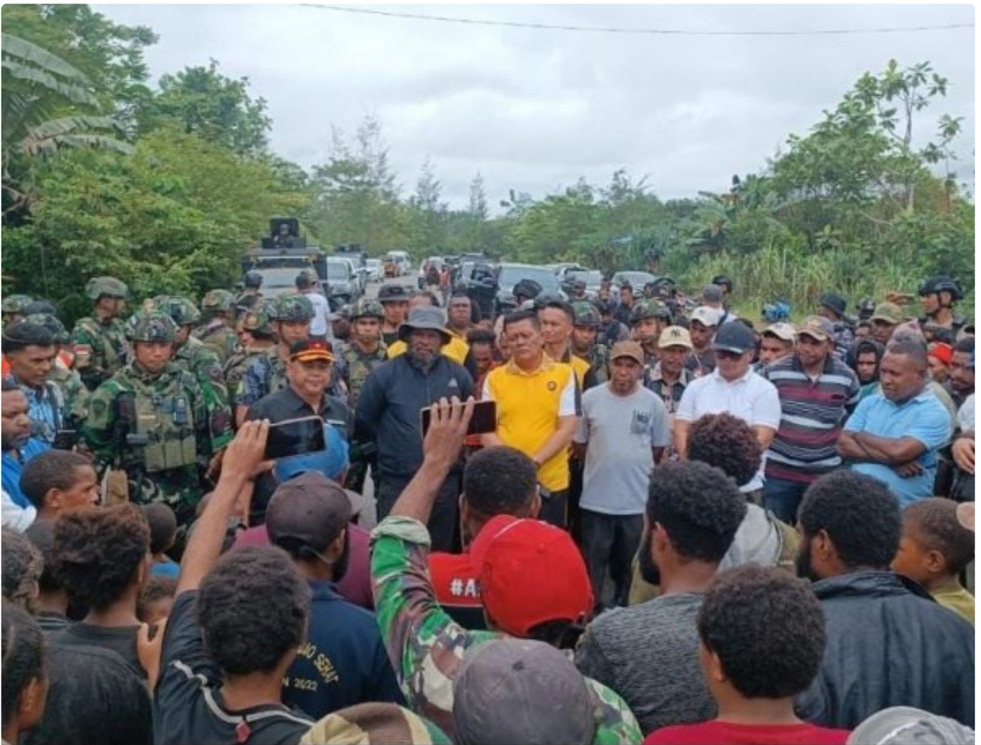
Foto: Satgas Batalyon Infanteri 6 Marinir Bersinergi Dengan Pemda Kabupaten Yahukimo Laksanakan Komunikasi Sosial Papua. Senin (01/07/2024).

YAHUKIMO- Satuan Tugas (Satgas) Batalyon Infanteri 6 Marinir merupakan bagian dari Komando Operasi TNI (Koops) Habema bersinergi dengan Pemda Kabupaten Yahukimo laksanakan Komunikasi Sosial di wilayah Yahukimo,