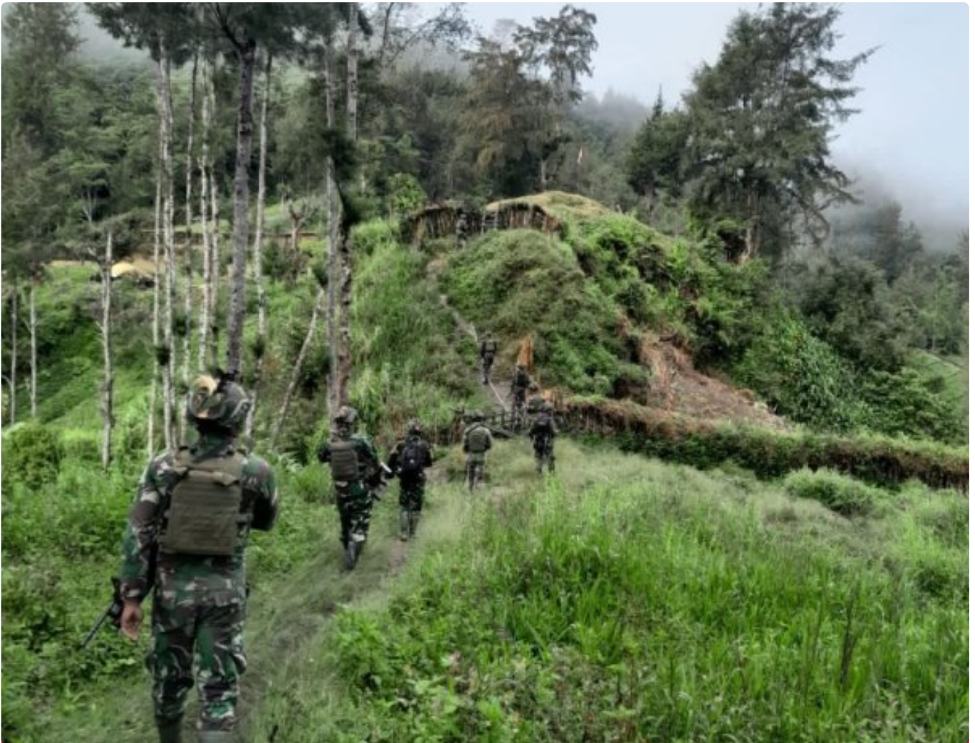
Satgas Mobile Yonif 323 Buaya Putih Berhasil Lumpuhkan Toko OPM

Insiden terjadi saat pasukan Satgas Yonif 323 Buaya Putih Kostrad melaksanakan patroli untuk menjaga keamanan di sektor wilayah tanggungjawabnya di wilayah kampung yenggernok, Distrik Gome, Kabupaten Puncak, Papua, Senin (02/12/24)