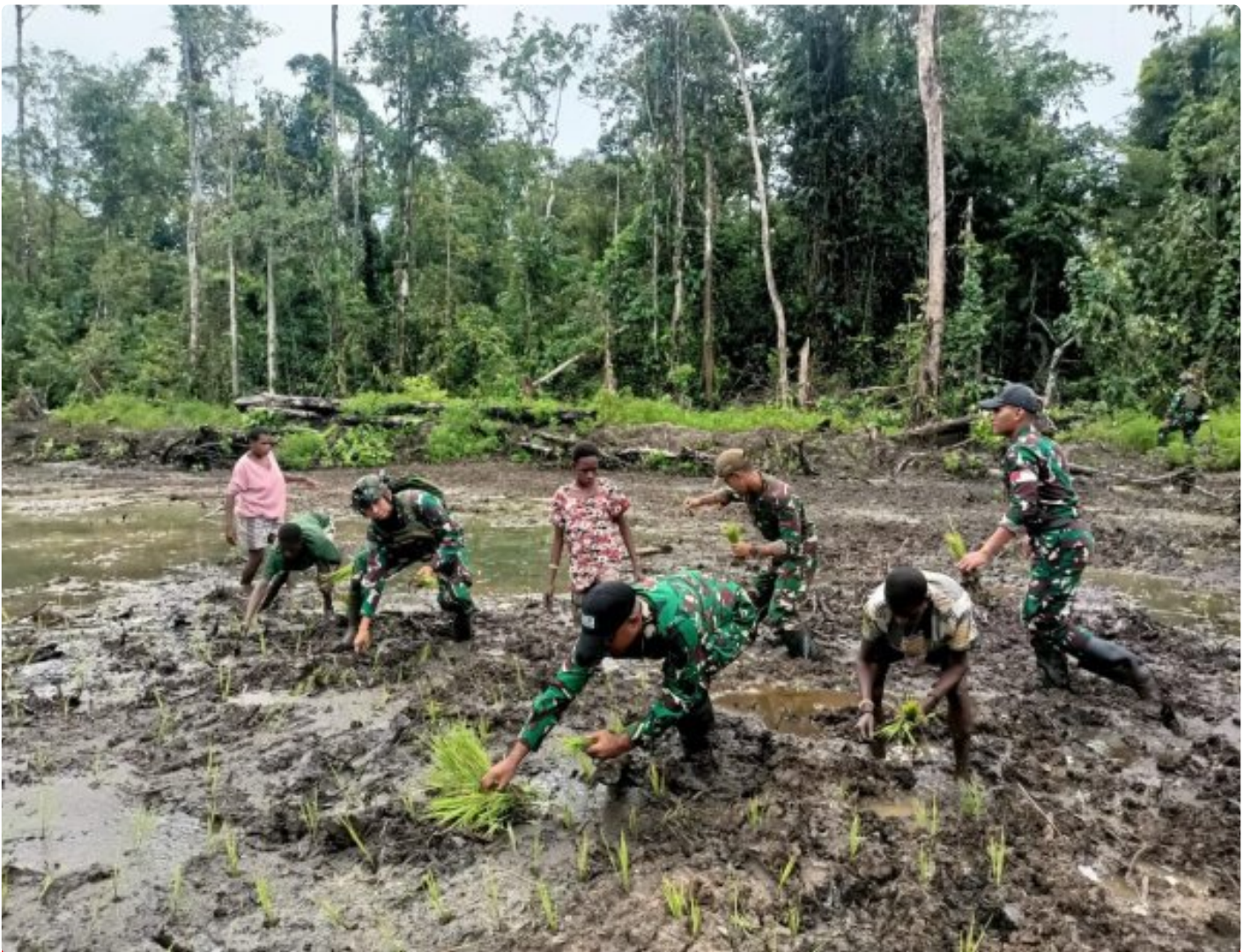
Foto: Satgas Pamtas Mobile RI-PNG Yonif 503/Mayangkara menggagas program ketahanan pangan yang melibatkan langsung warga Kampung Mumugu, Distrik Krepkuri, Kabupaten Nduga, Selasa (07/01/2025).

NDUGA- Dalam upaya membangun kesejahteraan masyarakat di wilayah penugasan Papua Pegunungan, Satgas Pamtas Mobile RI-PNG Yonif 503/Mayangkara menggagas program ketahanan pangan yang melibatkan